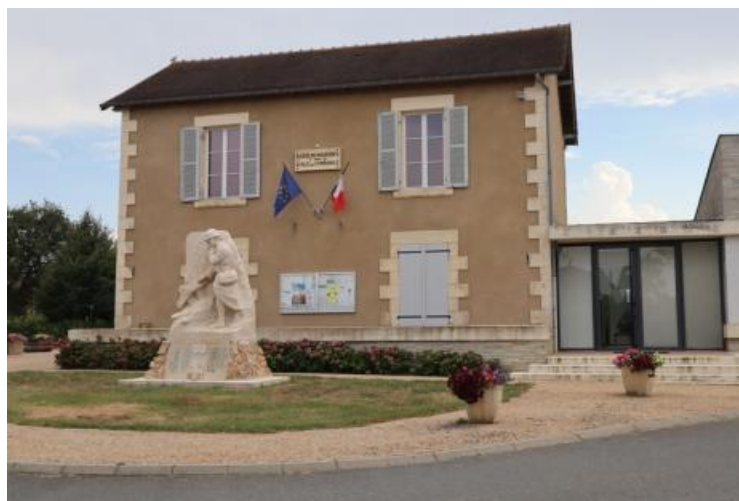
Mairie de Roussines