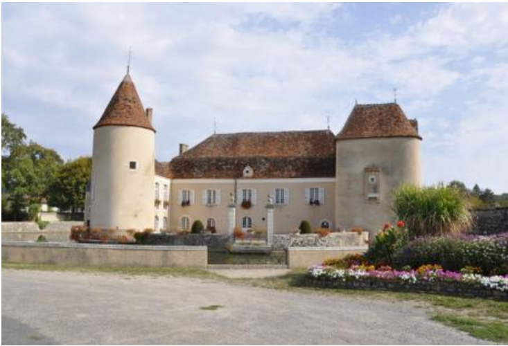
Mairie du Pêchereau