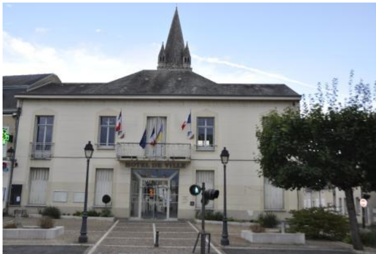
Mairie de Déols