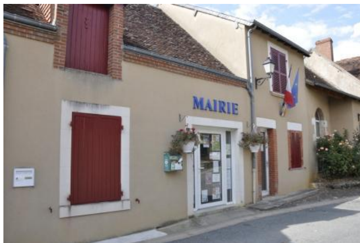
Mairie de Chavin